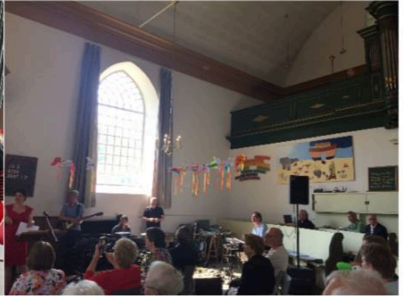
De pinksterduiven vliegen door de kerk.