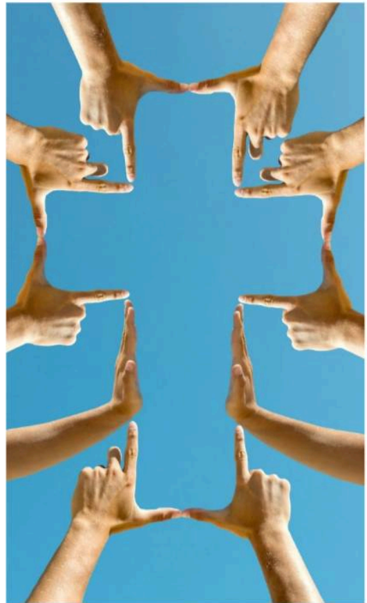
Handen die een kruis vormen © Louis Louro Kunstenaar