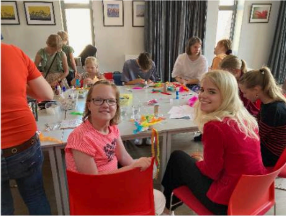
De Kinderkerk vol enthousiasme aan de slag.