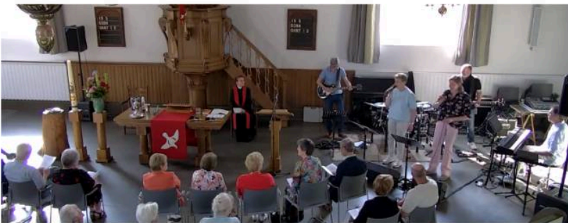
Gospelband Amio gaf naast het orgel een extra muzikaal tintje aan de dienst.