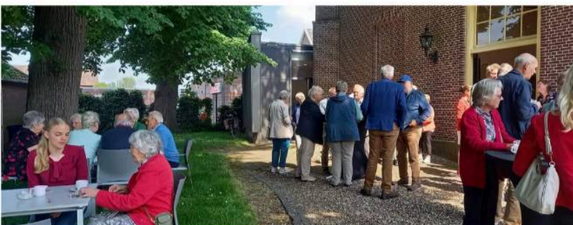
Na dienst was er tijd voor koffie en een praatje. En door het mooie weer kon dit buiten.